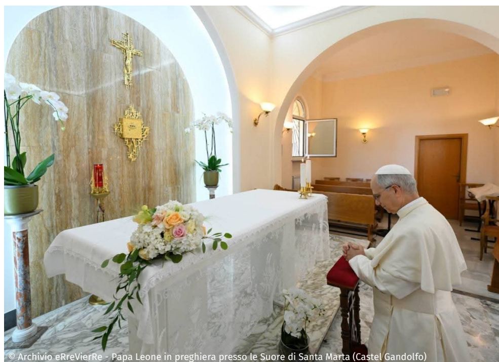
Papa Leone in preghiera presso le Suore di Santa Marta (Castel Gandolfo)