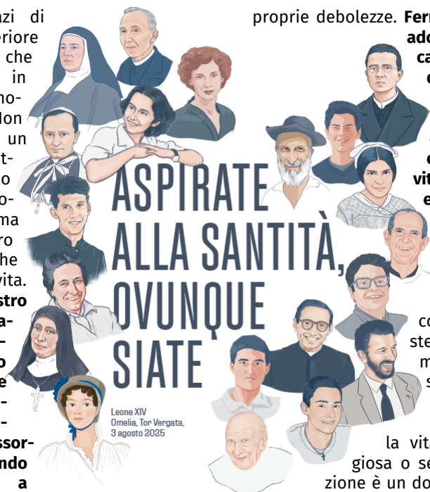
Leone XIV Omelia, Tor Vergata, 3 agosto 2025

La vocazione, in effetti, non è un traguar-